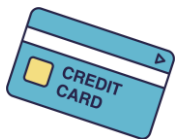
クレジットカード